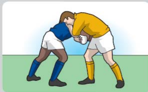
Maul no formado

maul después del Line out, que los saltadores hayan apoyado ambos pies en el los jugadores podrán empujar la formación de la siguiente manera: