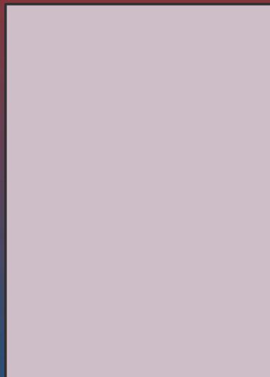
36 BARLA CRUZ (REGATAS BELLA VISTA) - FULLBACK / APERTURA - 30/10/06 1,74 - 73,10