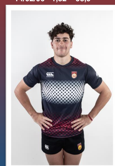
20 PLAZA JUAN SEGUNDO (LOS MATREROS) - APERTURA 08/02/06 - 1,78 - 85